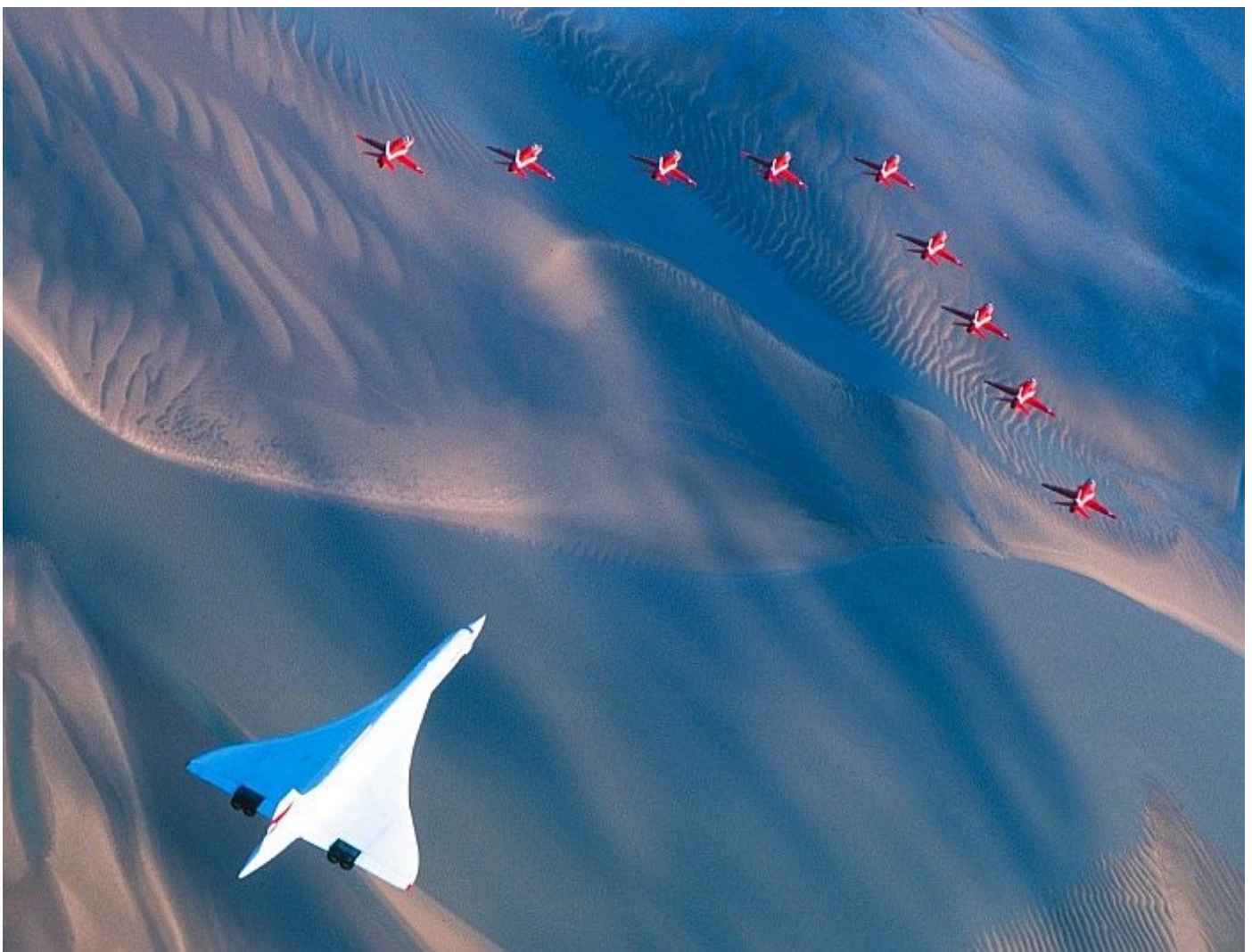
Concordens sidste tur